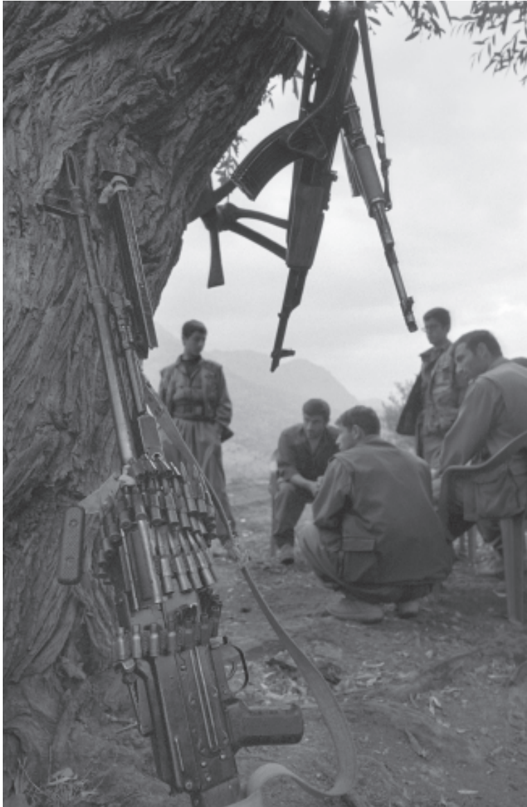
PKK trainingskamp.

Turkije heeft sinds enkele maanden een omvangrijke en goed uitgeruste troepenmacht samengetrokken langs de grens met Irak. Zware Amerikaanse druk zou er toe hebben bijgedragen dat is afgezien van een grensoverschrijdende operatie. Maar het is niet alleen de dreiging van een Turkse interventie in Iraaks-Koerdistan die leidt tot oplopende spanningen in de regio. Ook acties van het Iraanse leger, dat eind augustus en begin september een grote militaire operatie uitvoerde in Iraaks-Koerdistan waarbij het tot zware gevechten kwam met de Iraanse zusterorganisatie van de PKK, en toenemende samenwerking tussen Turkije en Iran spelen een rol. Bovendien zijn de afgelopen maanden de spanningen in Turkije zelf hoog opgelopen. Een poging tot over- en inzicht.